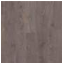
San Diego Oak