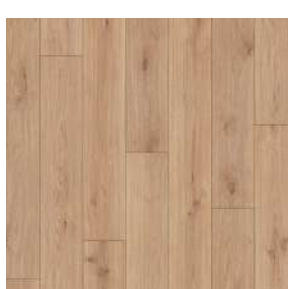
Clever Native Oak