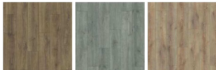
Clay Sola Oak