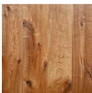
Smoked Elephant Skin