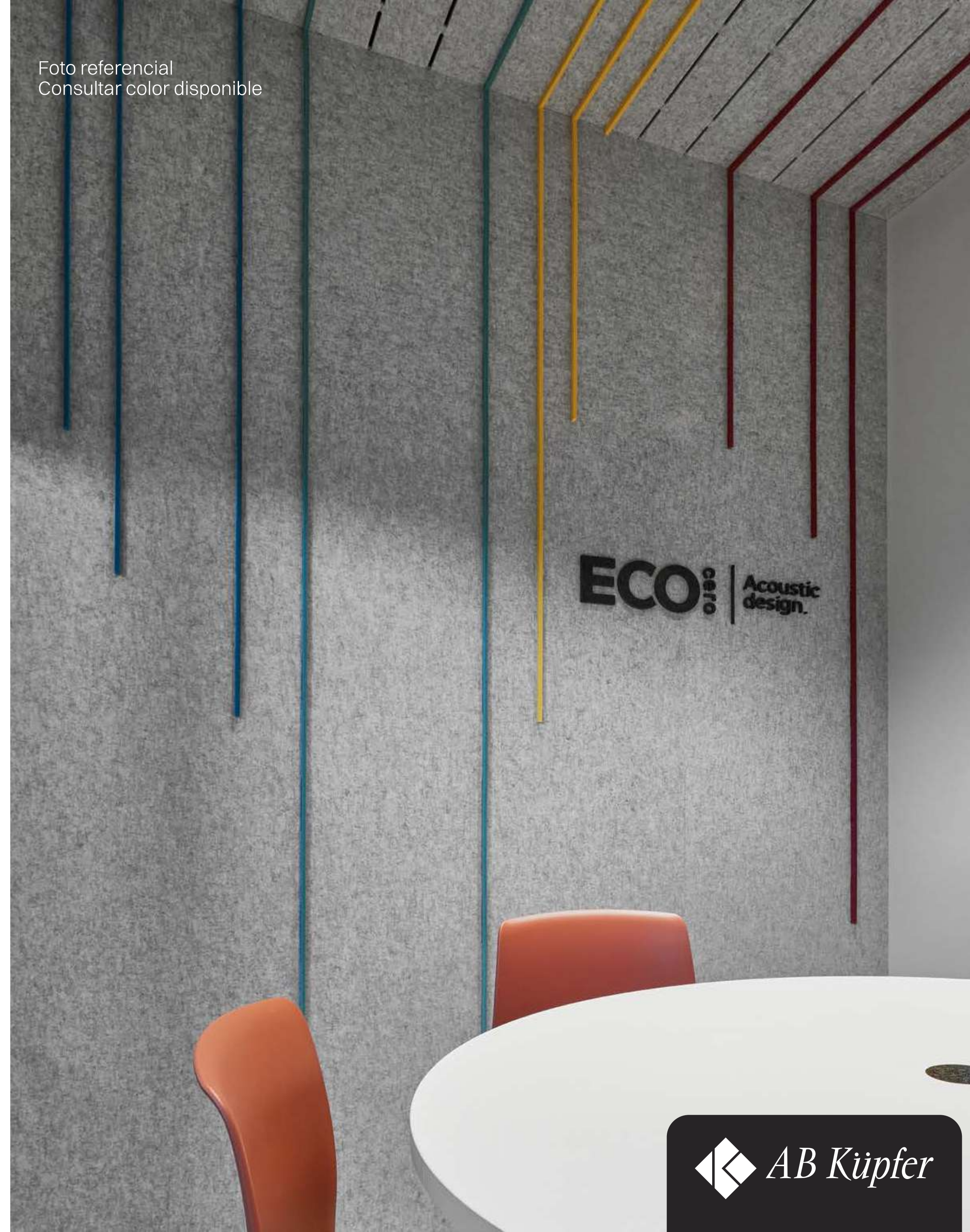
Foto referencial Consultar color disponible