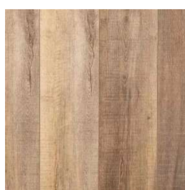
Sun River Oak