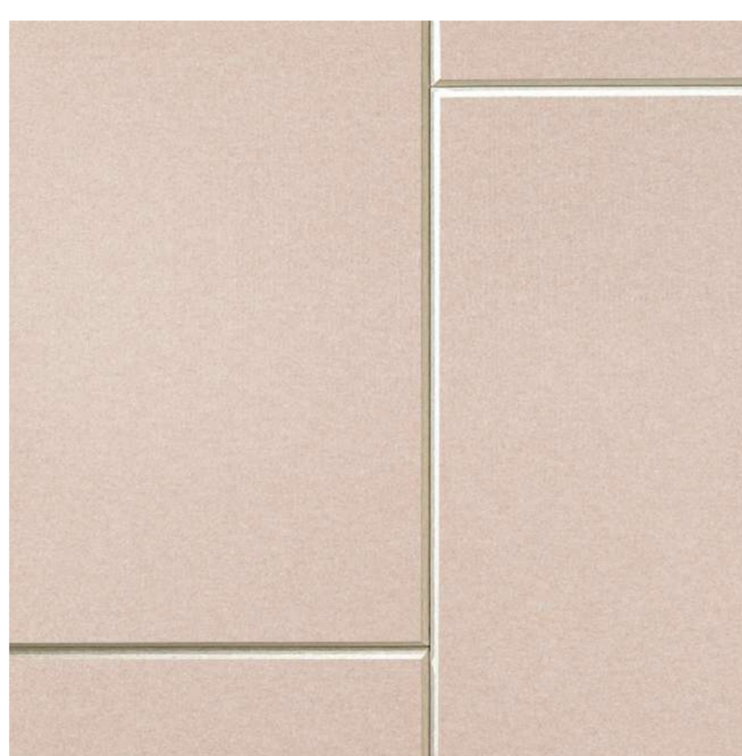
SLAT PANEL 2V Sand FG07