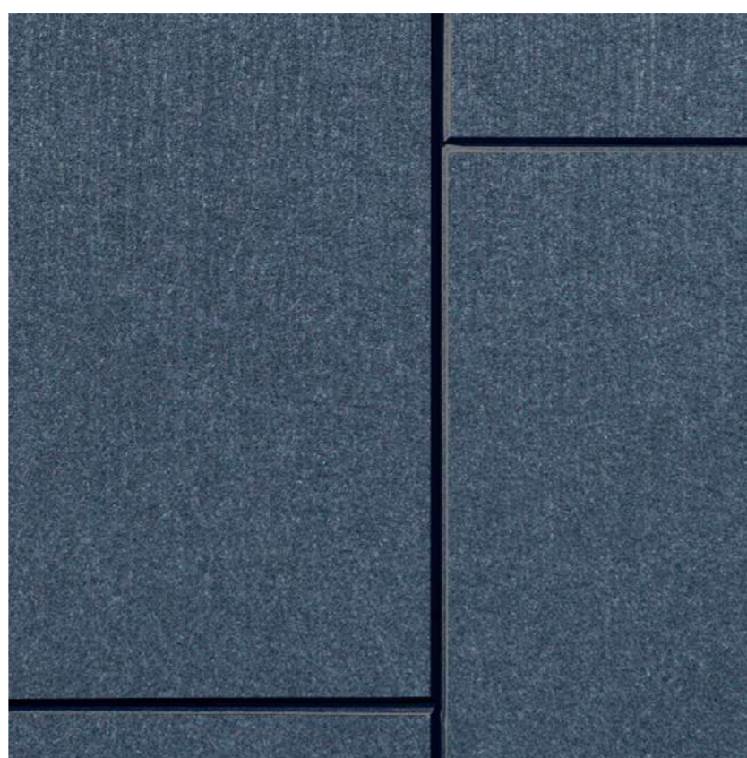
SLAT PANEL 2V Future Dusk FG04