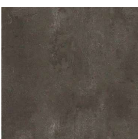
Palermo 457x914x6 mm