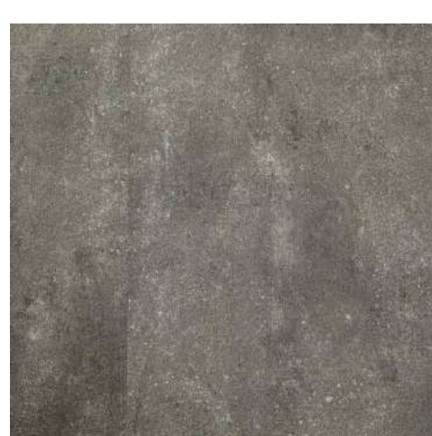
Milano 457x914x6 mm