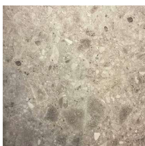
Terrazo 457x914x6 mm