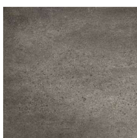
Taupe Stone 457x914x6 mm y 610x610x6 mm