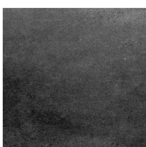
Black Stone 610x610x6 mm