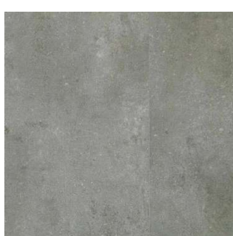
Monaco 457x914x6 mm